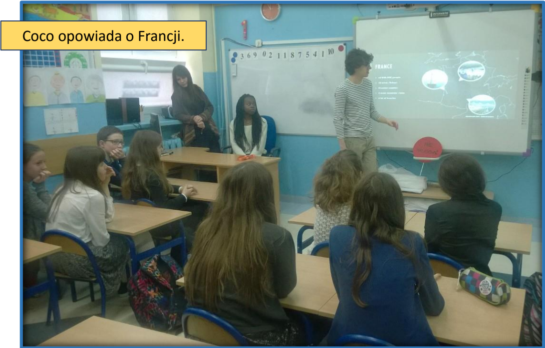
Coco opowiada o Francji.